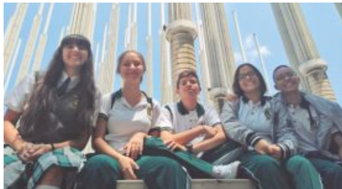
Estos son los jóvenes que hacen parte del proyecto Circuito Solar de EPM que desarrollaron un prototipo para generación de energía a partir del sol.