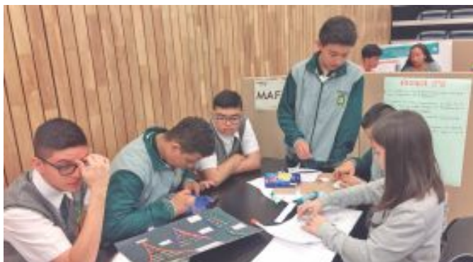
Los estudiantes del Colegio Cooperativo de Coomulsap aprovechan espacios de ciudad como el Parque Explora para tener un aprendizaje experiencial.

De esta manera, el cooperativismo, a través de una educación basada en el emprendimiento bajo una visión solidaria, busca generar sostenibilidad social, económica y ambiental al país para articularse con el cumplimiento de los Objetivos del Desarrollo Sostenible.