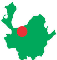
COOPERATIVA DE DESARROLLO INTEGRAL ALIMENTARIO DEL NORTE ANTIOQUEÑO DIA NORTE