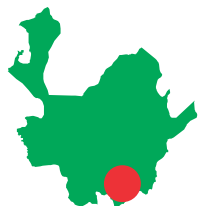
COOPERATIVA DE DISTRIBUCIÓN E INTEGRACIÓN AGROALIMENTARIA DEL ORIENTE DIA ORIENTE

Estas cinco cooperativas de segundo grado, agrupan en total, 42 organizaciones de productores, que a su vez asocian más de 3.000 productores agropecuarios.