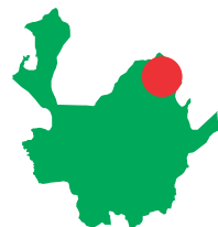
COOPERATIVA PARA EL DESARROLLO INDUSTRIAL AGROPECUARIO DIA BAJO CAUCA

Algunos de los propósitos específicos de las cooperativas DIA, son: