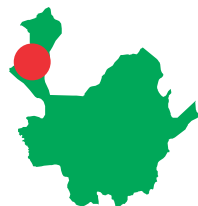
COOPERATIVA INTEGRAL DE ABASTECIMIENTO AGROALIMENTARIO DE URABÁ DIA URABÁ